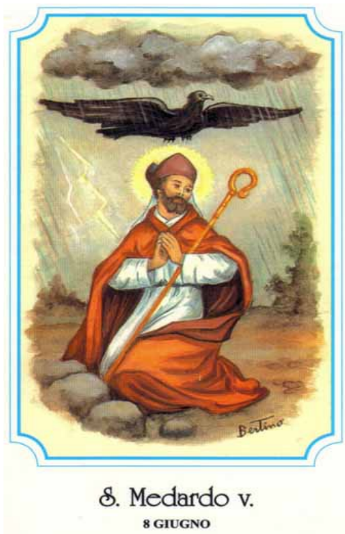
St. Medardo v. 8 GIUGNO